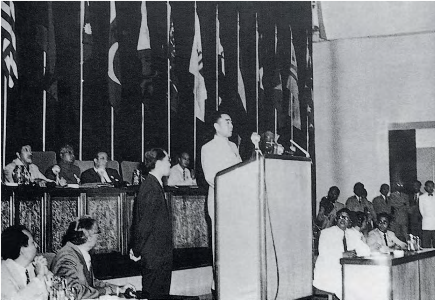
Ministerpräsident Zhou Enlai auf der Bandung-Konferenz im Jahr 1955

Hat Ihnen unser Newsletter gefallen? Sollten Sie daran Interesse haben, ihn auch weiterhin mindestens einmal im Monat zu beziehen, dann können Sie ihn per Mail hier abonnieren: